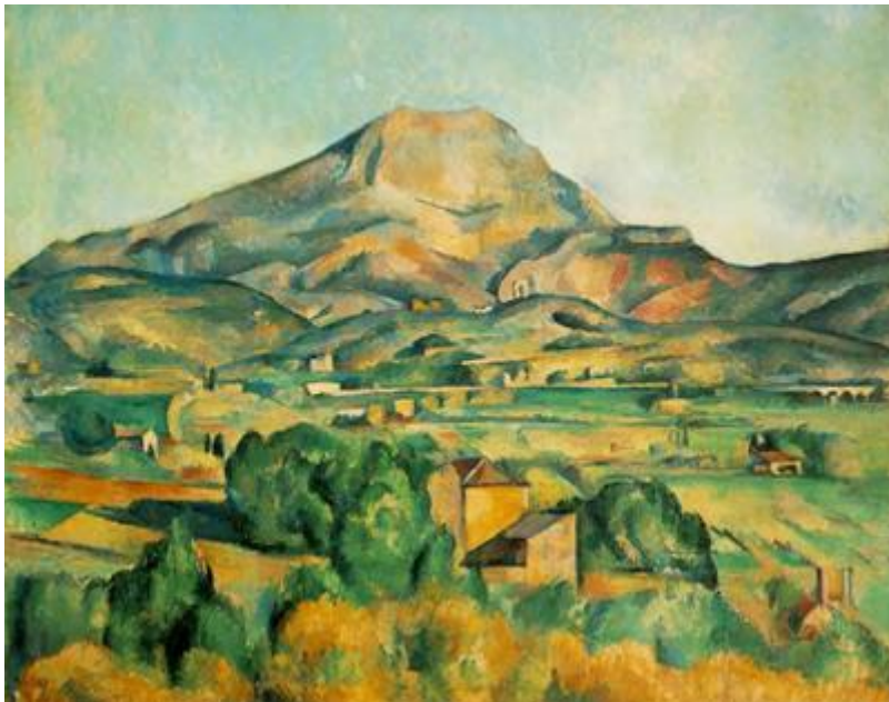
Paul Cézanne, La montagne de Sainte Victoire vue de Bellevue (1885).